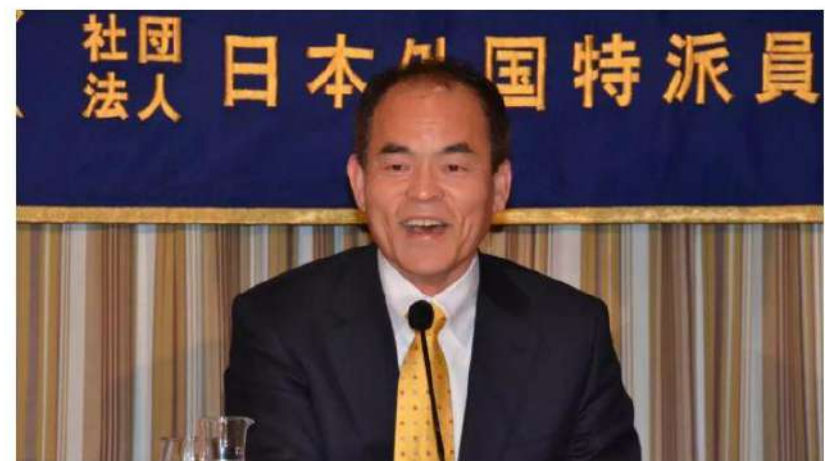
Shuji Nakamura says the Asian educational system "is a waste of time."