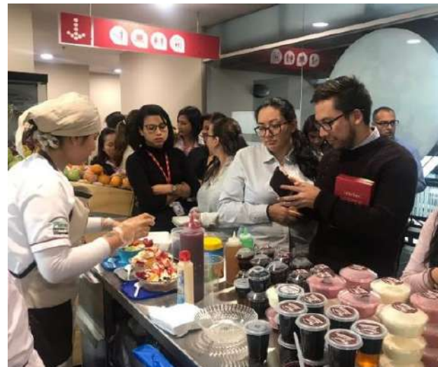
▶ De la Plaza a su Trabajo