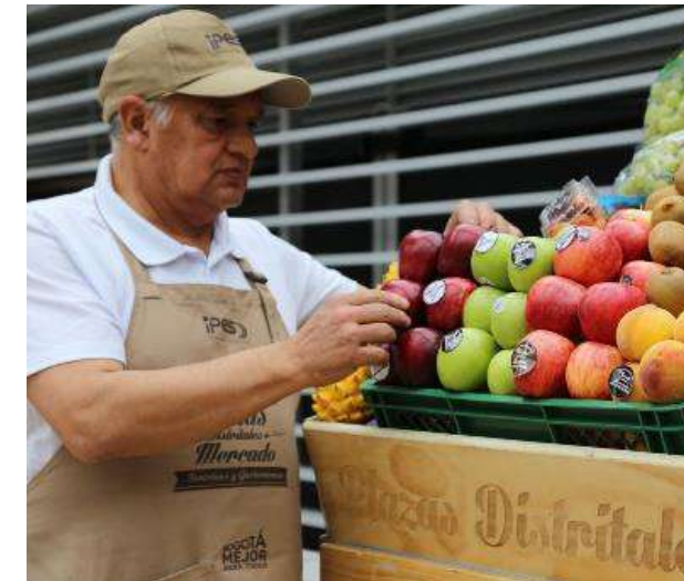
▶ Cumbre revista Semana