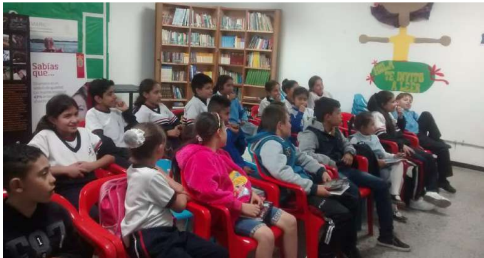
▶ Punto de lectura