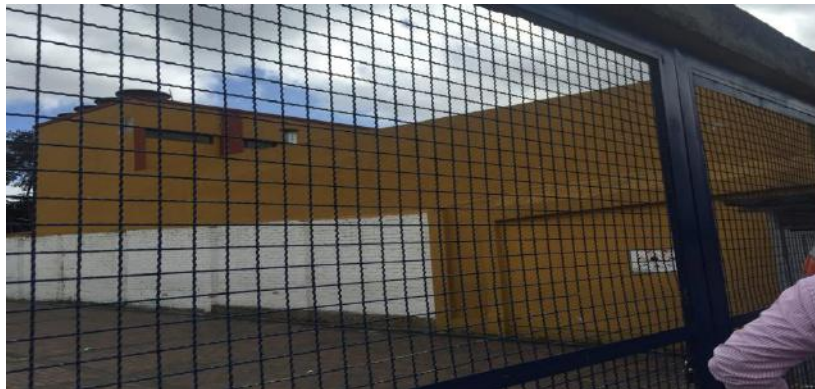
Menores cantidades en pintura antihumedad