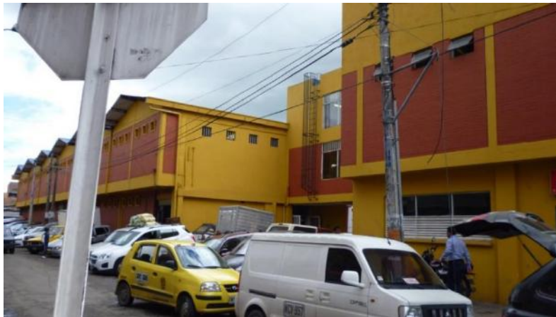
Menores cantidades en lavado de fachada