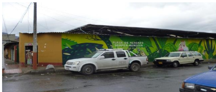
Mural no pintado