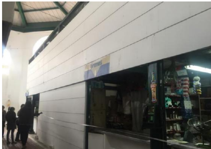
Menores cantidades en lavado de fachadas