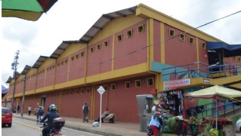
Menores cantidades en pintura antihumedad