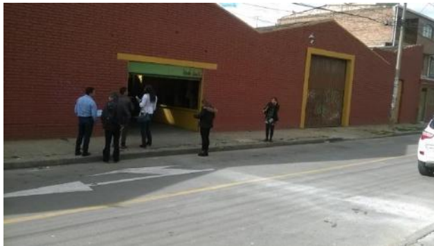
Menores cantidades en pintura antihumedad