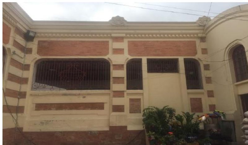
Impermeabilización de canales no ejecutada