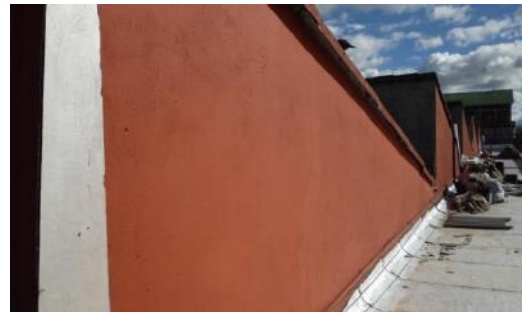
Limpieza de canales no ejecutada