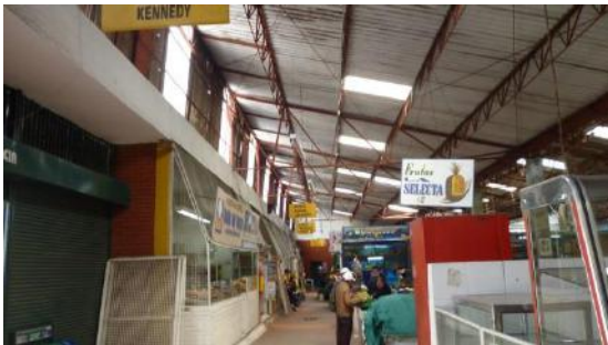
Mantenimiento de cubierta no ejecutada