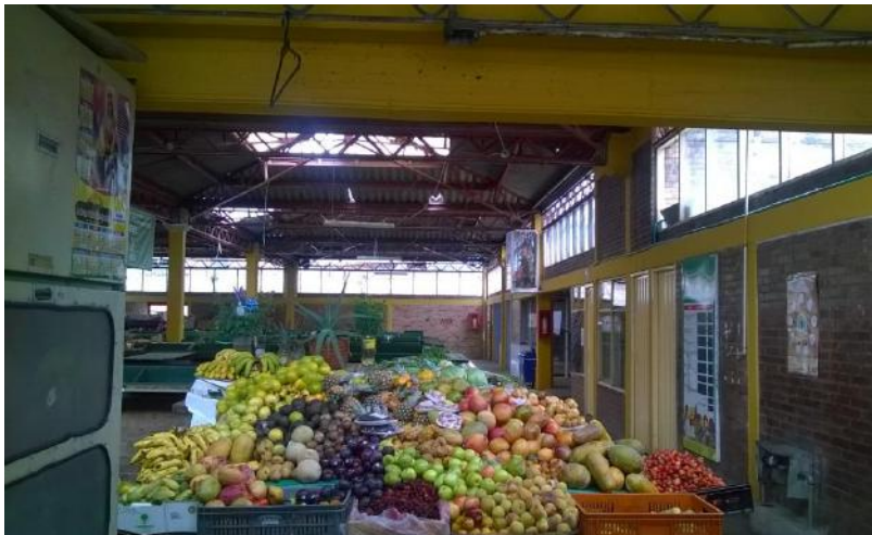
Menores cantidades en pintura antihumedad