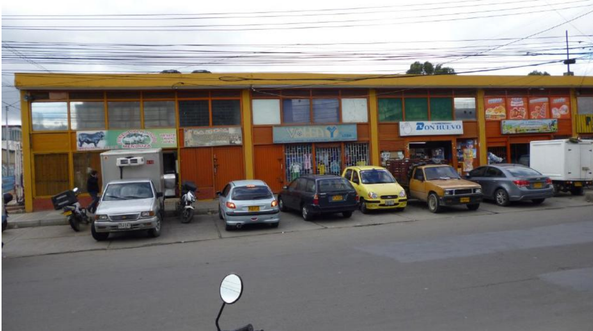
Mediciones de pintura en fachada principal