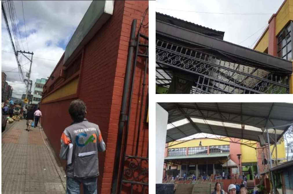
Menores cantidades en lavado de fachada y en pintura antihumedad