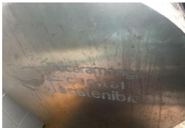
Módulo deteriorado y con marca de otra ciudad