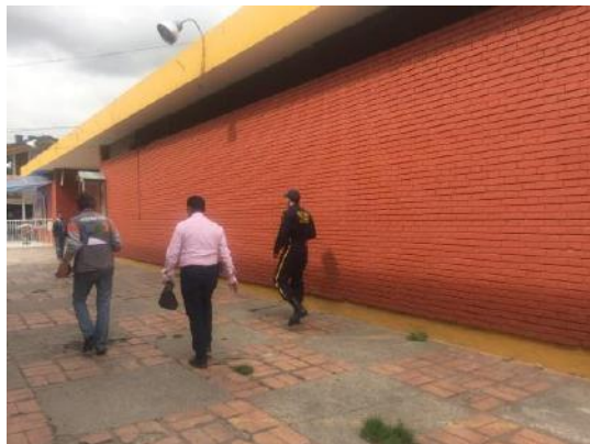
Menores cantidades en pintura antihumedad