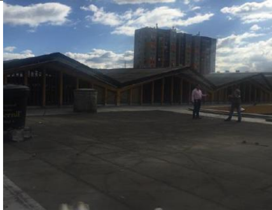
Impermeabilización de cubierta no ejecutada