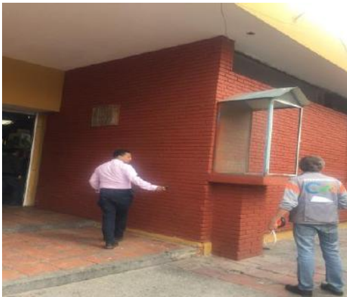
Menores cantidades en lavado de fachada