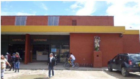
Menores cantidades en lavado de fachada