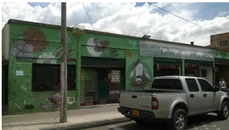
Murales no pintados