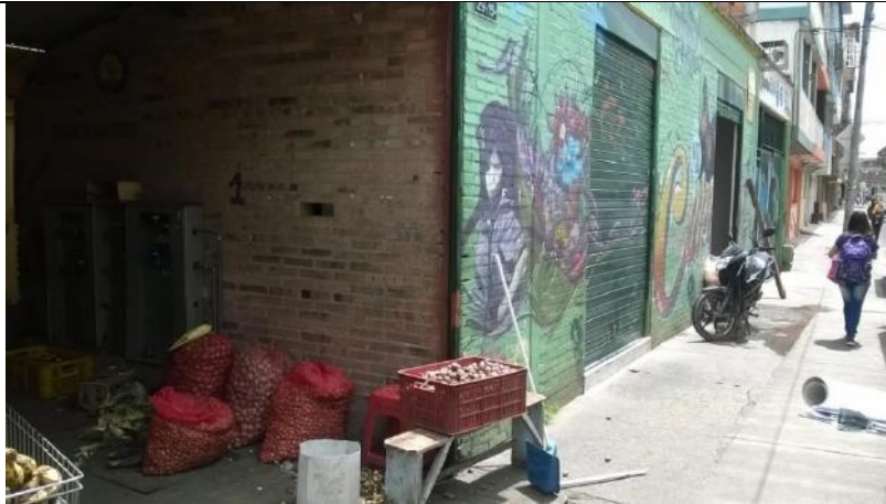
Murales no pintados