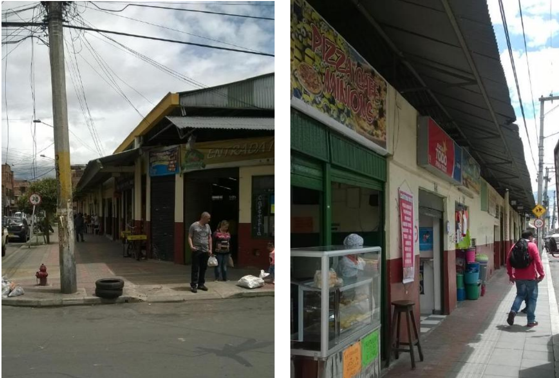
Menores cantidades en pintura antihumedad