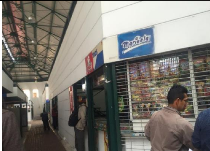
Menores cantidades en pintura antihumedad