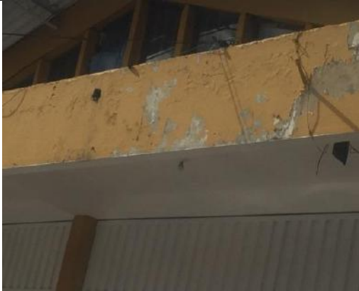
Pintura antihumedad deteriorada

“Por un control fiscal efectivo y transparente”