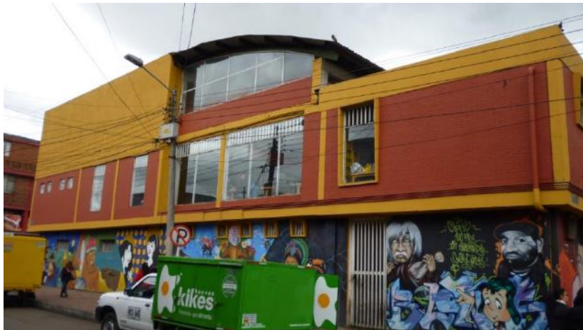
Murales no pintados