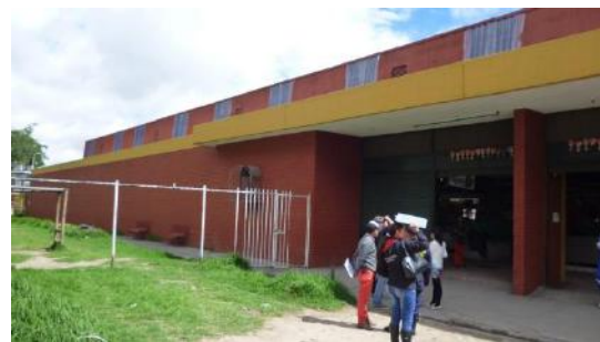
Menores cantidades en pintura antihumedad