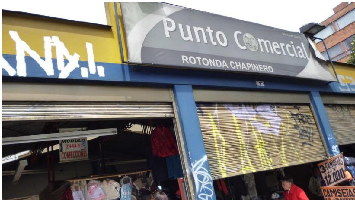
Limpieza y mantenimiento de canales no existentes