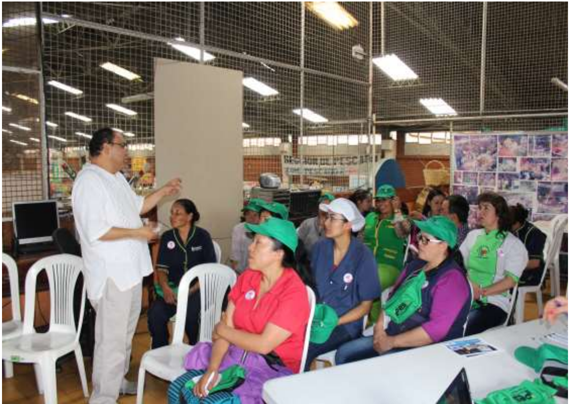
Foto 1: Funcionario de la Veeduría Distrital

4. Identificación de las necesidades de formación del grupo objetivo: la necesidad de la comunidad es conocer herramientas para el control social a la gestión pública y saber la manera como el IPES hace la inversión de los diferentes programas y proyectos de la institución.