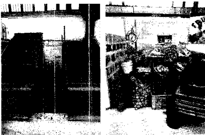
REMODELACIÓN MODULO SALVADOR LADINO