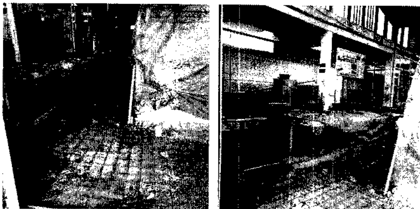
INTERVENCIÓN PISOS Y COCINAS CONSORCIO MIRALLES