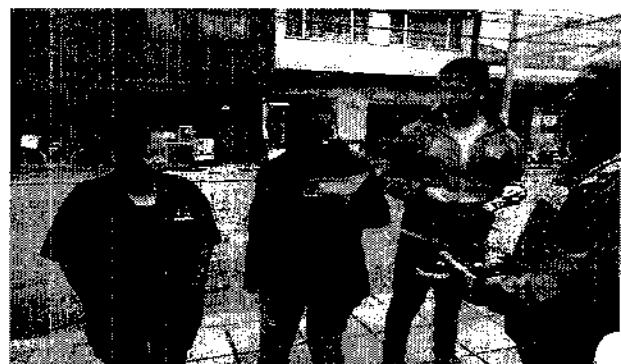
Invitando a la comunidad