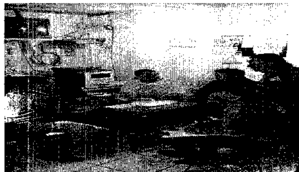
Reunión infraestructura y ambiente