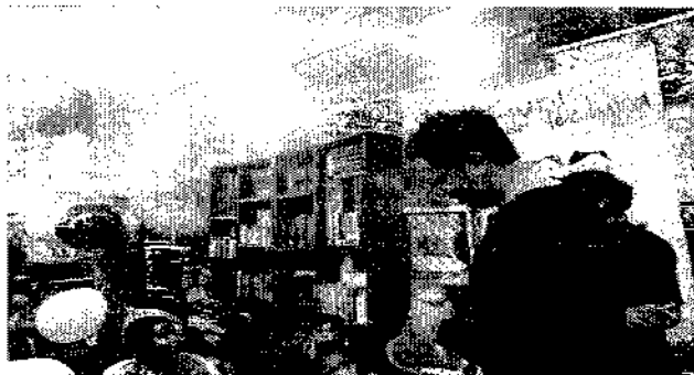
Actividad punto de lectura