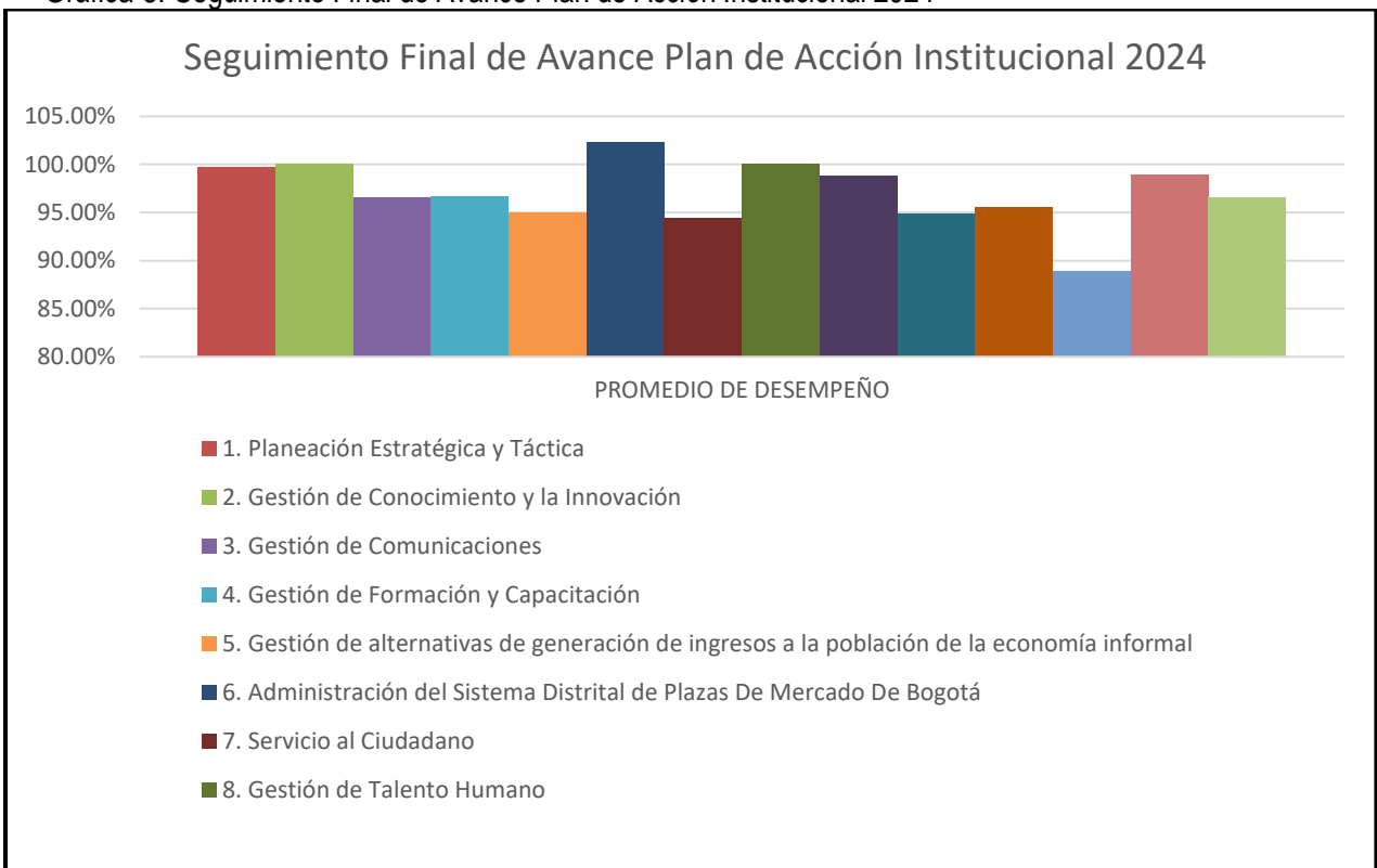
Gráfica 3. Seguimiento Final de Avance Plan de Acción Institucional 2024